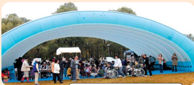
多くの方に来場いただきました!