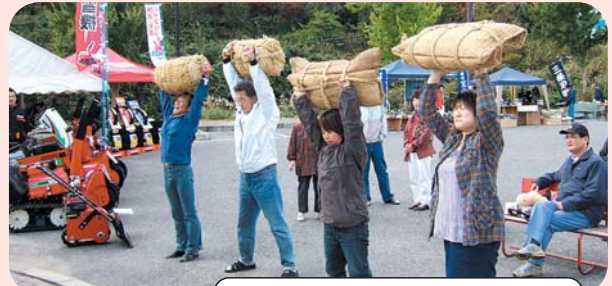
多くの方が参加した力自慢大会