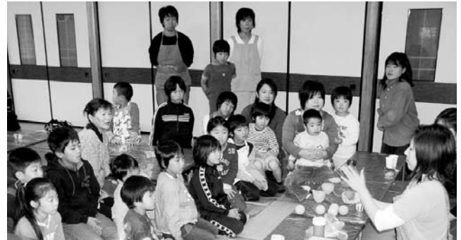
▲家庭教育推進事業（親子で楽しむ陶芸教室）

執行状況は、歳出で16億1,647万円。予算額に対し44.4%を執行しています。下半期にかけて取り組まれる建設事業等を考慮すれば、順調な執行状況となっています。