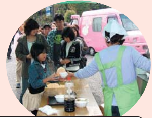
大行列となったきのこ汁のサービス

きのこ汁のサービスを始め、豪華賞品がもらえる力自慢大会や大抽選会など各種イベントに、多くの観光客が挑戦。歓喜の声が終始会場に響きました。