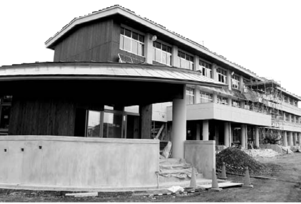
▲さくら小学校校舎改修事業