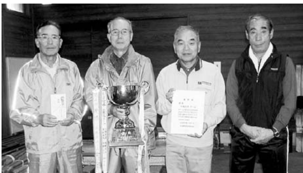
▲団体の部優勝 松陽台A 見事3連覇達成です!