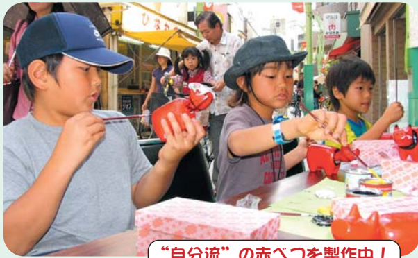
“自分流”の赤べこを製作中!