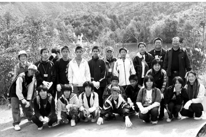
▲ようこそおいでくださいました!(磐梯山噴火口にて)

米のおむすびや高原野菜たっぷりのきのこ汁と一緒に秋の味覚を味わいました。 松原・裏磐梯地区の7軒の民家に2日間滞在した訪問団は、沖縄県では見ることができない紅葉に歓喜しながら、裏磐梯の雄大な自然の美しさと人情味に触れ、交流を深め合いました。