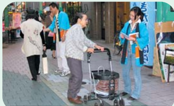
すずらん商店街で村をPRしました!

東京都杉並区すずらん通り商店街で行なわれたすずらんフェスティバル。10月6、7日の2日間に渡って開催され、高原野菜やきのこなどの秋の味覚や裏磐梯の紅葉の美しさを約6,000人の区