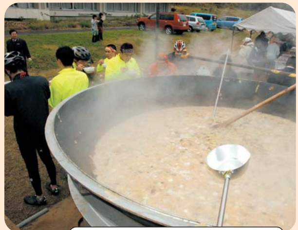
大きな鍋の前で食事をする参加者たち

小雨模様にもかかわらず、紅葉を見に訪れた観光客など約2,000人に、大鍋きのこ汁を無料で振舞いました。