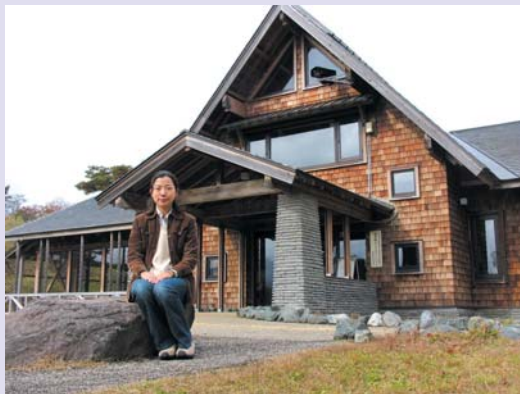
▲今年6月に発足した裏磐梯エコツーリズム協会事務局は、裏磐梯サイトステーション内にあります！（裏磐梯サイトステーション前にて）

例えば、裏磐梯には全部で200ほどの施設があります。この施設の人全員が、観光客に対し裏磐梯という地域の特徴を共通の認識で伝えることが大切だと思うんです。また、タイムリーな情報をみんなで共有し、