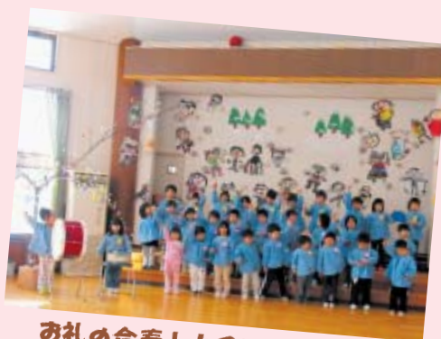
お礼の合奏！上手にできました

ーションをしたり、お昼にはだんごや長寿会皆さん手作りの豚汁で会食をし、笑顔でいっぱいの日となりました。