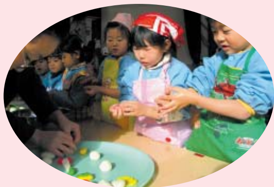
「おばあちゃん、丸めるの上手だね！」

村内の各幼稚園では1月12日(金)、長寿会のおじいちゃんおばあちゃんと一緒にだんごさしを行いました。