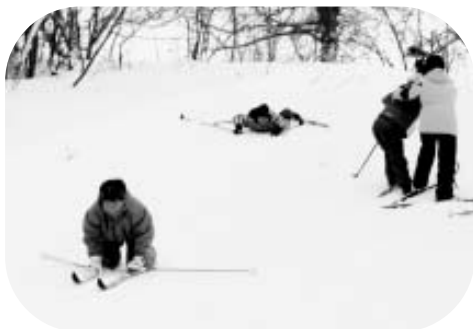
▲滑って…転んで…助けられて！

2日目は、裏磐梯猫魔スキー場でアルペンスキーを体験。村の子どもたちがいわきの子どもたちと交流を深める姿がほほえましく映りました。最後にはいわきの子どもたちも全員滑れるようになり、楽しい活動となりました。子どもたちは、夏と冬の交流を通じて、友情を深め、別れを惜しんでいました。