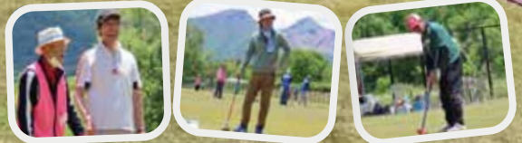
小さな村の郵便局長さんたち