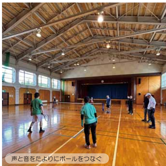
声と音をたよりにボールをつなぐ

6月6日（土）～6月7日（日） 視覚障がいを持つテニスプレイヤーとサポーター7名が練習目的で東京から来村されました。パラ競技の体験ができると聞きつけたテニス歴の長いベテラン含む10名が練習に参加。視覚障がい者のサポート術やルールを学んだのち、同じ土俵で勝敗を競い楽しみました。ブラインドと晴眼の1対1のガチ対決では、両者ゆずらぬラリー戦となり、称賛の拍手がわくシーンも！このスポーツは、見えても見えなくても優劣なく一緒に楽しめることが醍醐味のひとつです。