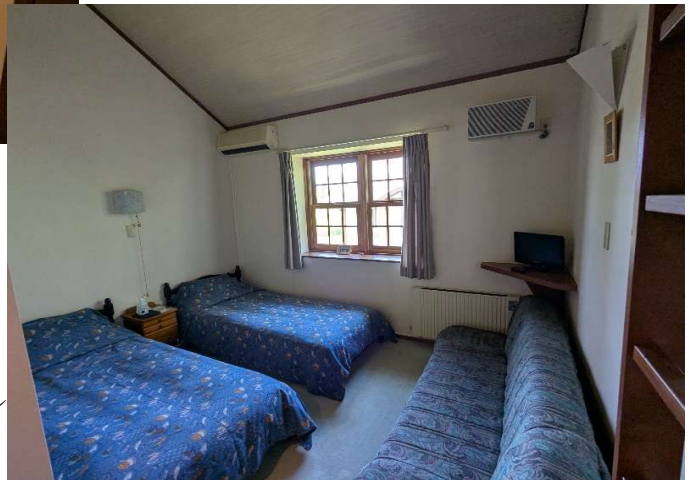
客室5 → (洗面台・トイレ ロフト付)