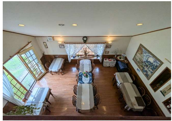
ホールから食堂が見えます。