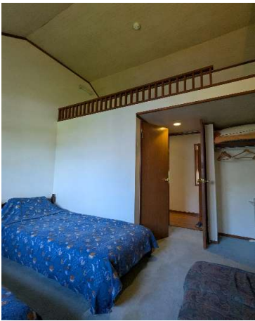
客室4 → (洗面台・トイレ ロフト付)