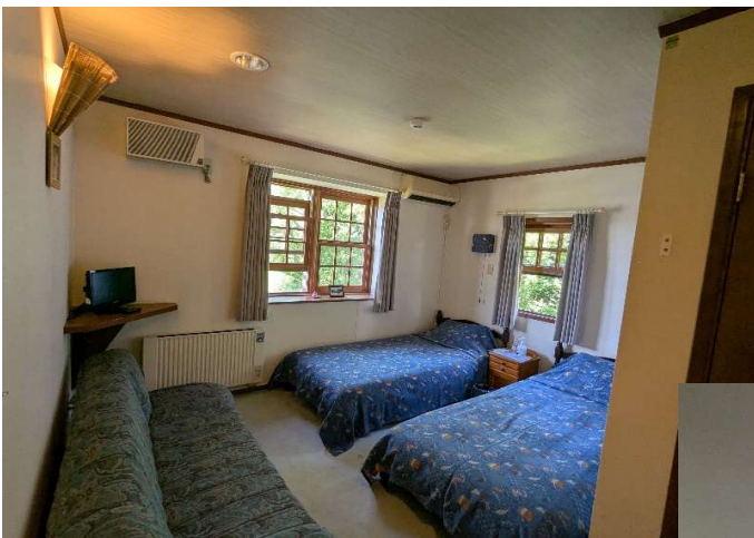
客室6 (洗面台・トイレ付)