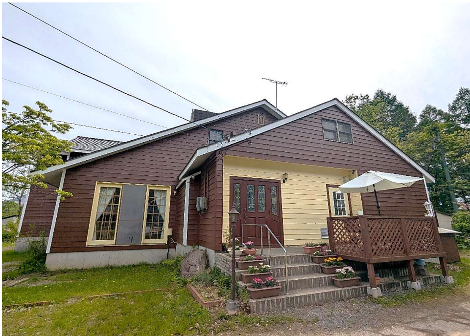
北東側外観（玄関・食堂）