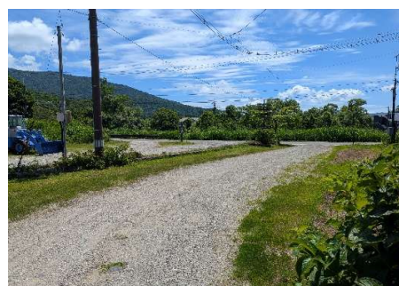
入口通路（敷地内・村道に接道）