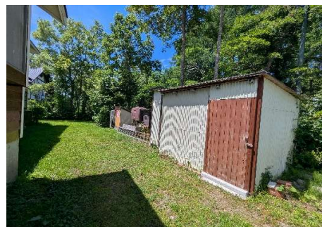
物置き・受水槽・灯油タンクなど （北西側にあります）