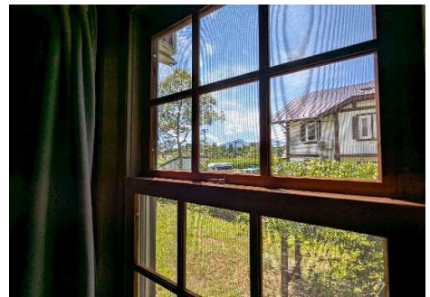
客室2側窓 (磐梯山が見えます)