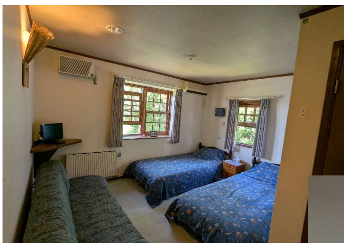
客室6 (洗面台・トイレ付)