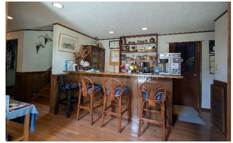
ホール・カウンター