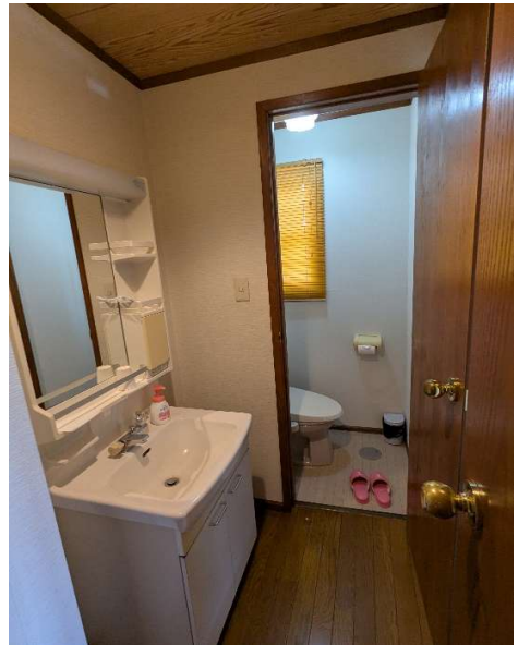
客室1の洗面台・トイレ