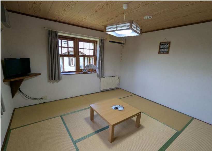
客室3 (洗面台・トイレ付)

※写真掲載はしていませんが、他に厨房・物置き・プライベートスペースとして オーナーズルーム・客室7・納戸（事務所）などがあります。