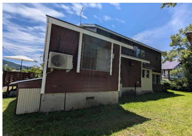
北西側外観（厨房・浴室など）