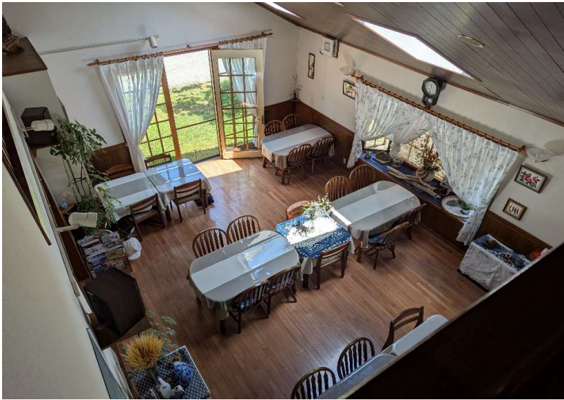
食堂（2階から撮影）※屋根改修済（天窗を塞ぎました）