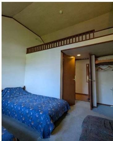
客室4 → (洗面台・トイレ ロフト付)