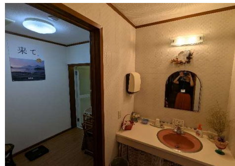
脱衣室2・洗面所（浴室2側）