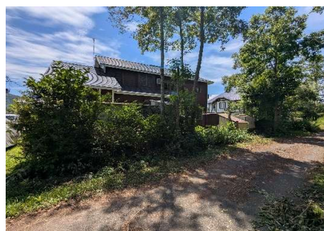
北西側境界（私道に隣接）