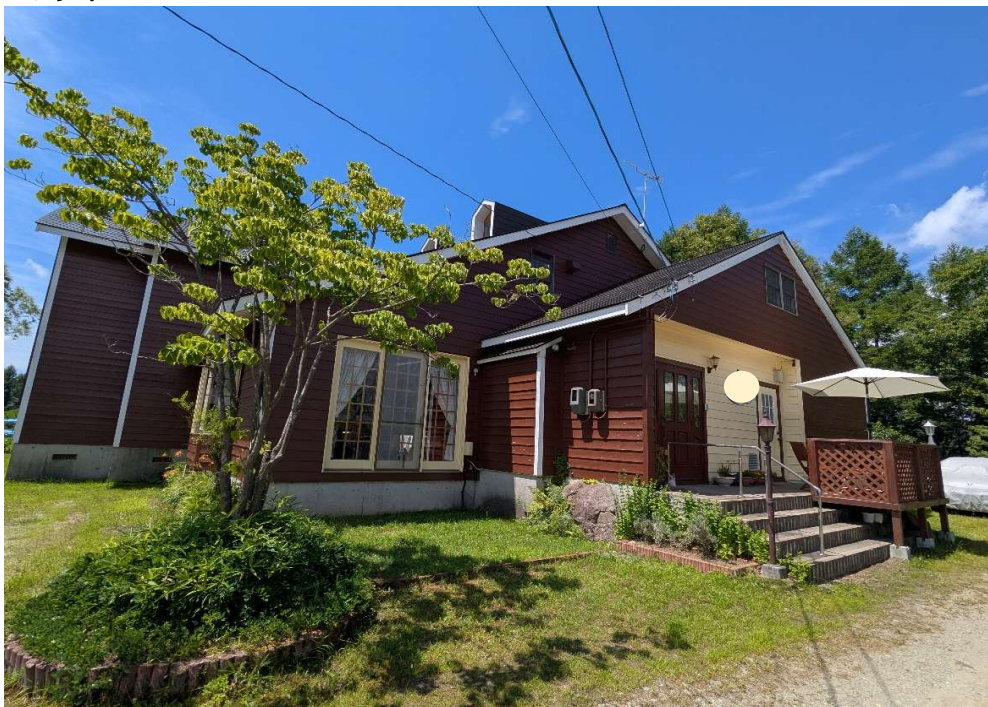
北東側外観（玄関・食堂）