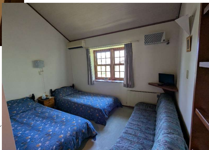
客室5 → (洗面台・トイレ ロフト付)