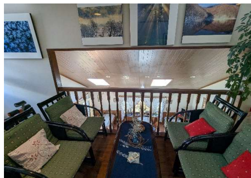
ホールから食堂が見えます。