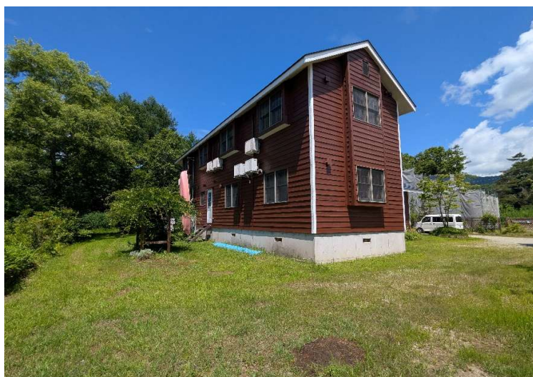
南東側外観（客室など）