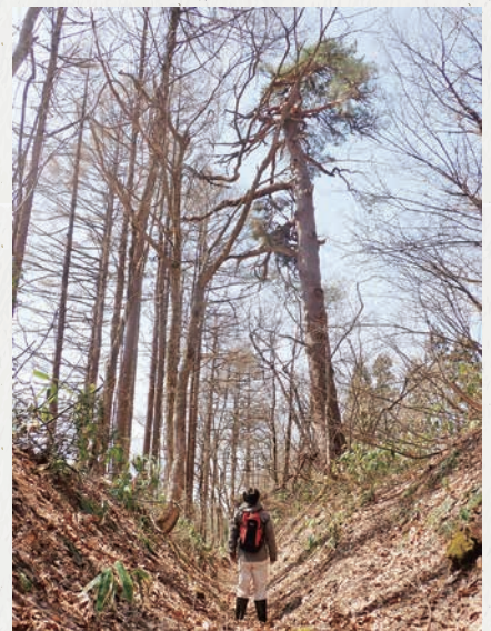
【写真】旧街道で旅人を見守るアカマツ

古い道が良い状態で残されており、周辺の一里塚などとともに松並木が江戸時代の面影を今に伝えていています。ウォークに参加して、歴史と自然を満喫しながら当時の旅路を追体験してはいかがでしょうか。