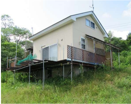
全景 ※デッキは改修した為写真と一部異なります。