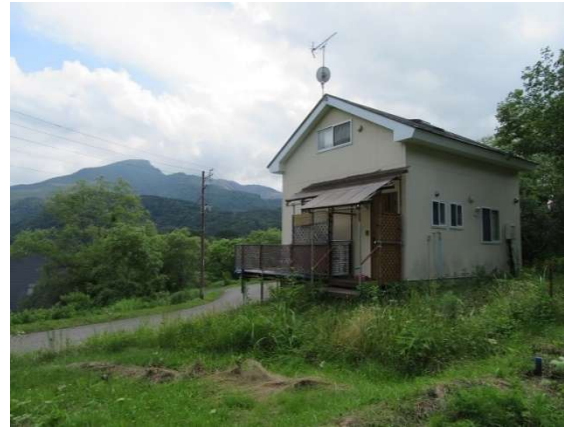
全景② (建物左側に見える山は磐梯山)