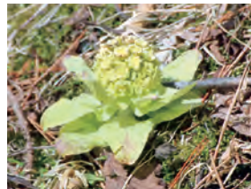
▲春を告げるフキノトウ

自然解説員と一緒に、春を探しに散策してみませんか?お気軽にお問い合わせください。