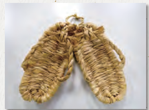
▲作っていただいた アシダカゾウリ

3月15日は「靴の記念日(靴の日)」だそうです。今回はそうした履き物にちなんだ内容です。写真は「アシダカゾウリ」(以下、「草履」と書きます。)と呼ばれる履き物です。作られた方は、最後に作ったのが17~18歳の頃に約70年ぶりに作ったとのことでした。パーツによっては稲わらを「縷う(糸やひもなどをよりあわせる)」ねじりの向きが決まっていること、自分の手指の幅や長さをもとに草履の大きさを決めるなど、人間の手や体にしみついた「手わっさ」というのは時を経ても残っているものだなあと改めて感じました。作られた方に草履にまつわる思い出はないですかと尋ねたところ、草履を履いて当時所属していた青年団の面々と金山から木々をかき分け山道を通り、綱木そして米沢に出て、そこから福島市で開催された国体を観に行ったのが思い出だなあと懐かしそうに語っていました。後日調べてみると国体は昭和27(1952)年10月に開催された「東北3県国体」でした。当時、「西吾妻スカイバレー」や「鷹の巣山林道」は開通していないので会津・米沢街道を歩き米沢に向かったと思われますが…物凄い思い出話、びっくりの連続でした!!