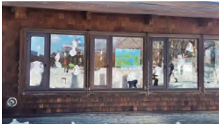
▲裏磐梯幼稚園園児の作品

当館1Fの窓が、裏磐梯幼稚園の子どもたちの作品ギャラリーとなっております。2月21日に開催された「裏磐梯雪まつり」を賑わせてくれたものですが、雪が溶ける春までは展示を続けさせていただきますので、ご来館のうえぜひ実物をご覧くださいませ!また、今シーズンは雪が少なめで気温も乱高下気味のようです。スノーシュートレッキングの際は、当館にお立ち寄りのうえ周辺のコンディションをスタッフまでお尋ねください。