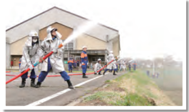
地域を守るため訓練を重ねる消防団員