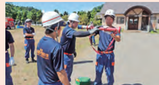
新入団員には基本から丁寧に教えます

「地域の役に立ちたい」「無理のない形で参加したい」そんな思いを、消防団で形にしてみませんか。