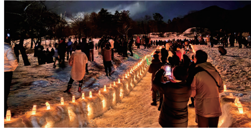
裏磐梯雪まつりナイトファンタジー