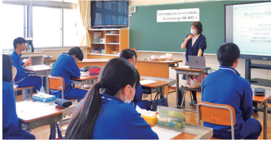
思春期講座(第一中学校)