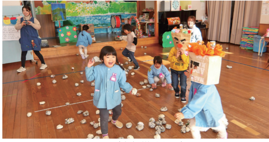
豆まき(裏磐梯幼稚園)