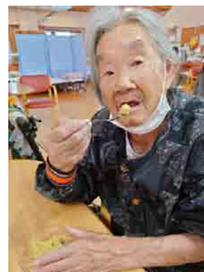
美味しく頂きました(^ ^)