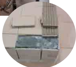
タイルが剥がれちゃった