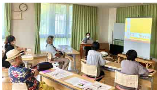
← 認知症サポーター養成講座の様子