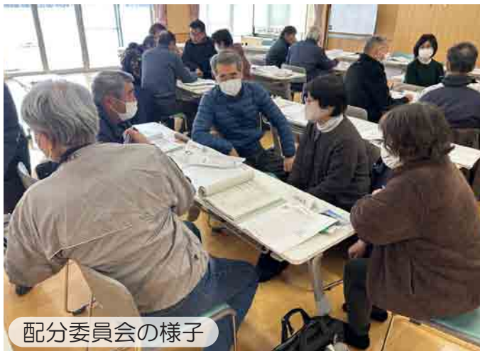
配分委員会の様子