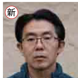
曾原・狐鷹森 中森正茂