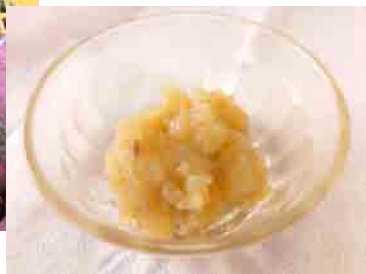
さつまいもがきんとんに変身!!