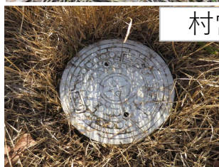
村営下水道引込済