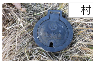
村営上水道引込済