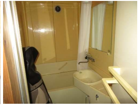
サニタリールーム