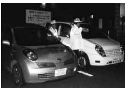
自分たちの地域は自分たちで守ります!!

各地区に分かれて、家の戸締まりや車のキーの取り忘れ、ロックの不備など1軒1軒確認し、戸締まりの重要性を呼びかけました。防犯協会裏磐梯支部では、自分たちの地域を自分たちで守るため毎月10日の「防犯の日」に防犯パトロールを行っており、今後も犯罪のない安全で安心して暮らせる地域づくりを目指します。