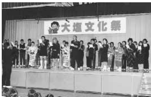
歴代の3つの校歌をPTAが中心となり大合唱

展示コーナーにはそれぞれが心をこめて作った作品が展示され、来場者の目を引いていた様子。保健センターでも、健康にチャレンジ「ココナ」を設け、健康づくり事業の一環として、握力測定や歯と歯茎の健康チェックを実施しました。秋随れとなった各会場では、人の出足が好調で、多数の保護者や地区の方々が来場し、賑いを見せました。