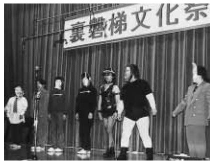
今年も盛り上げてくれました!! いつも元気過ぎる!?! 松原婦人会