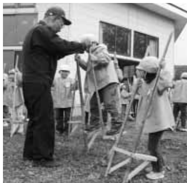
“イッチニ、イッチニ” おじいちゃんと一緒にだから 安心だよ!

子どもたちからはお礼の気持ちを含めて元気いっぱいのお遊戯を披露したほか、長寿会の皆さんと一緒にサンドイッチをつくり昼食をとるなど、温かい笑顔に包まれた一日を過ごしました。