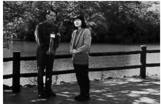
◀裏磐梯をご訪問され、五色沼自然探勝路をご散策されたときの様子

このたび、天皇家の長女紀宮様のご結婚され、11月15日に都内のホテルにて結婚式が挙行されました。紀宮様は、平成7年10月17、18日の2日間に渡りご来村されたこともあり、本村にとってとても馴染みの深いお方です。