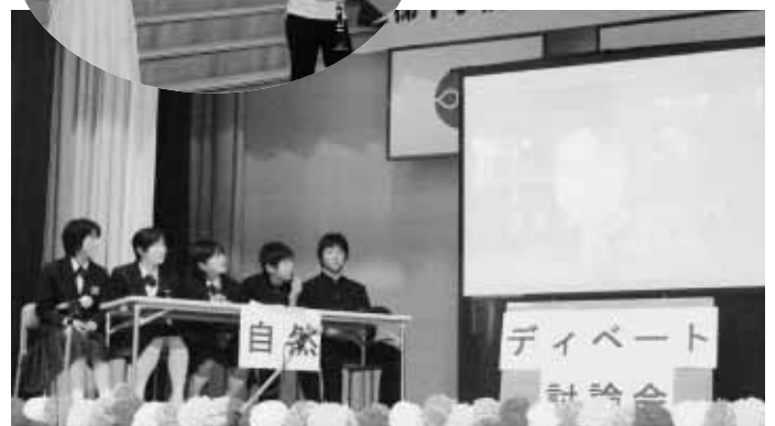
今後の裏磐梯の在り方について真剣にディベートしました。