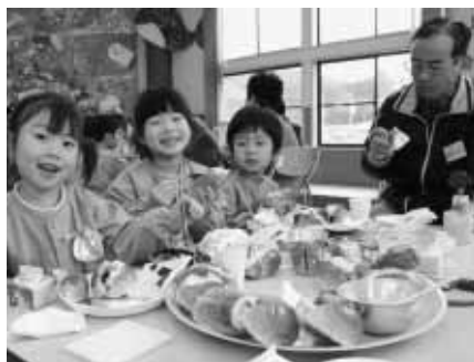
とてもおいしく、 楽しく作ることができました!!