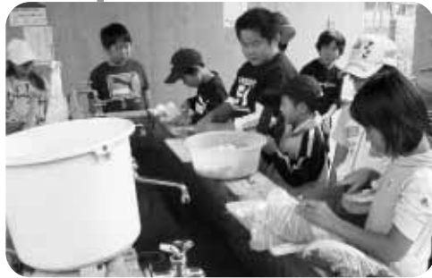
うまく切れるかな？

年間を通してさまざまな体験活動を行うチャレンジスクールが10月1日、いこいの森グリーンフィールドにおいて行われました。「秋のお楽しみ会」と題した今回は村内の小学生22人が参加。慣れない手つきで材料を切りながらも、大鍋で本格的なとん汁を作ったほか、プロペラ飛行機を作り、高さや飛距離を競い合うなどして遊びました。 最後には、みんなで作ったあつあつのとん汁を食べ、交流を深め合うなど、子どもたちは、お腹も心も大満足の日を過ごしました。