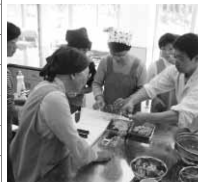
健康づくりを目的とした料理教室など各種講座を開催 （一般会計・衛生費）