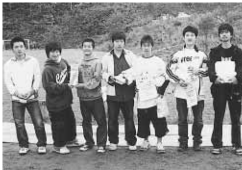
ボランティアで協力してくれた高校生

北塩原村長杯ふれあいグラウンドゴルフ大会は10月10日（体育の日）、いこいの森グリーンフィールドふれあい広場において開催されました。 あいにくの少し肌寒い天候の中、高校生から高齢者までの71人の参加者は、寒さを感じさせない熱のこもったプレーを繰り広げました。 初めて体験する高校生などはルールを覚えてもらいながらプレーを楽しんだほか、運営スタッフとしても活躍。朝早くからコース設置やスコア記入、後片付けなど一生懸命に行っていました。