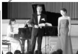
た。りまし 聞き入 名曲に 日本の 奏でる 歌声が 演奏と いピアノやフルートの演奏と

学社連携融合事業 「こころに優しい音楽会」 NPO法人アイエイピー（会津若松市）を招いての音楽鑑賞会が10月13日、裏磐梯小体育館において開かれました。 参加した村内小学校の子どもたち約200人は、美しいピアノやフルートの演奏と歌声が奏でる日本の名曲に聞き入りました。