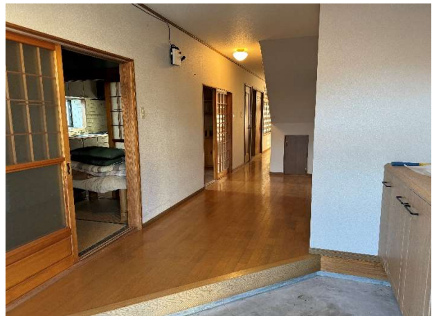
入り口玄関と廊下