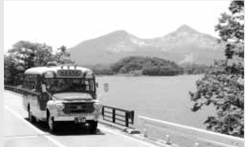
桧原湖周遊レトロバス運行事業