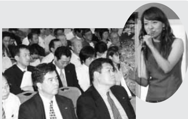
エコツーリズム推進事業 第1回エコツアーフェスタ