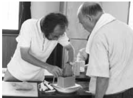
◀先生が指導してくれています。