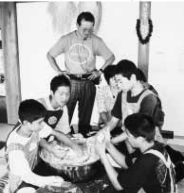
とても楽しく過ごせました!! 名物やせうま作り、試食、松のたまご