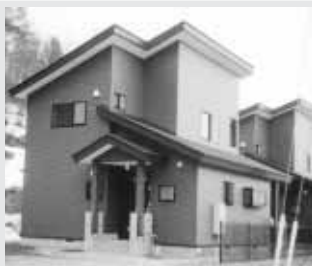
公営住宅整備事業