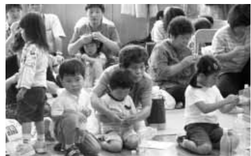
細かい部分もせっせと作業！！

ペットボトルを握ったり離したりすることで、自由自在に浮き沈みさせることができる不思議なお魚に子どもたちは大喜び！その様子を見ていたおじいちゃん、おばあちゃんも本当に嬉しそうでした。