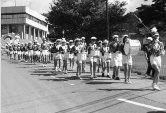
新しいユニフォームで、力強い演奏をする北山小学校鼓笛隊の子どもたち