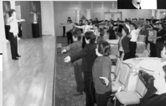
地域保健推進特別事業（はっぴーde美ユーター）