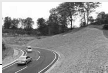
地すべり災害復旧事業で整備された蘭峠