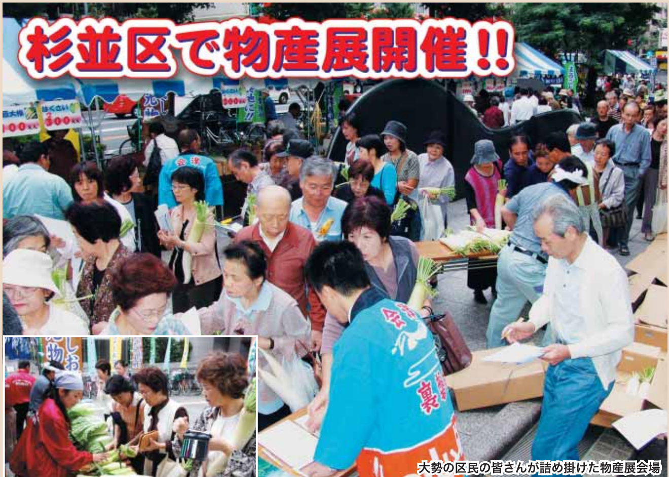
大勢の区民の皆さんが詰め掛けた物産展会場

10月1日現在の人口 男1,713人 女1,757人 計 3,470人(前月比 - 1) 転入15 転出16 出生1 死亡1 世帯数1,091(前月比1)