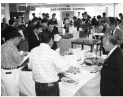
地域特産試作品を試食する出席者