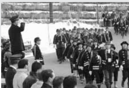
消防団による分列行進