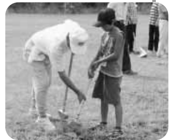
◀よくボールを見て…