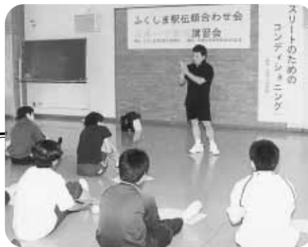
◀マッサージの仕方を熱心に学ぶ 候補選手