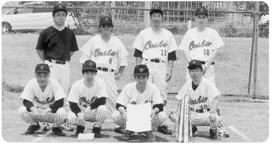
ソフトボール優勝大塩チーム

第55回福島県総合体育大会県民スポーツ大会北塩原村大会は、6月16日(日)、村民グラウンド・村民体育館を会場に、壮年ソフトボールと家庭バレーボールの2つの競技で、耶麻方部大会の出場権をかけた熱戦が繰り広げられました。 結果は次の通りです。 壮年ソフトボール 優勝 大塩チーム 準優勝 裏磐梯チーム 第3位 北山チーム 家庭バレーボール 優勝 北山チーム 準優勝 松原チーム 第3位 大塩チーム 優勝した両チームに加え、裏磐梯バドミントンクラブと北山卓球クラブが、7月7日、西会津町で行われる耶麻方部大会に出場します。各チームの活躍を期待しましょう。