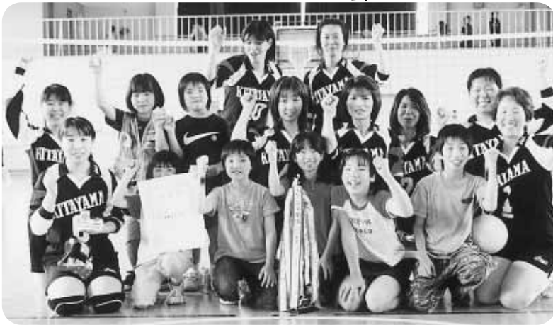
バレーボール優勝北山チーム

ひとりがいい！ふたりもいい！ 仲間が多ければもっと楽しい！ 生涯学習プラン等に こぞって、ご参加ください！