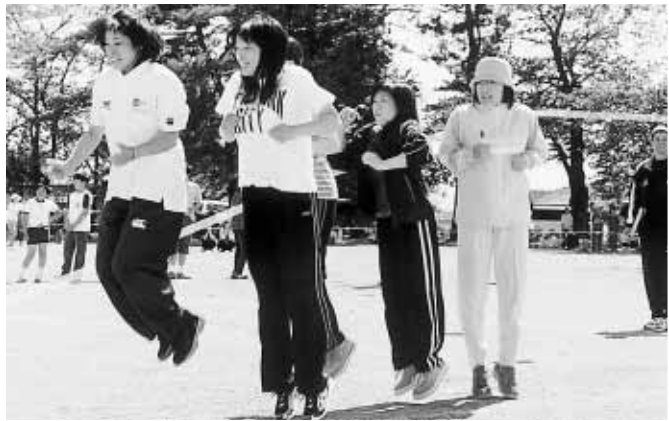
▼奥がかるいぞ！(北山)