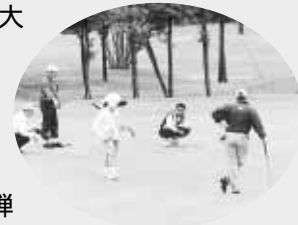
芝を読む目も真剣です

あいにくの小雨模様となりましたが、各参加者は、ベストスコアをめざし、集中してプレーしていました。