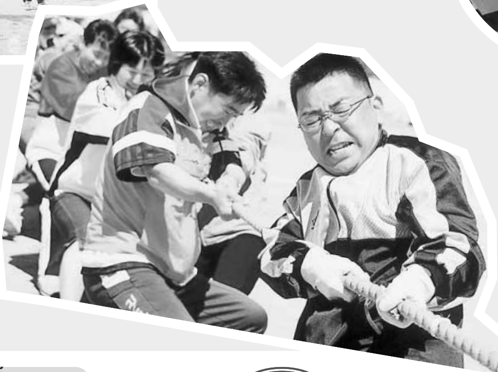
▶「北区對抗」な引き 接心の力ご (裏磐梯)