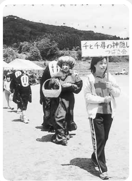
▶仮装競争「たぐさのヒーローが登場」(大塩)