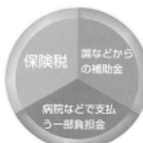
その年に予測される医療費