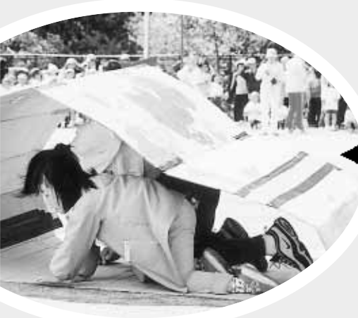
◀幼稚園親子による「がんばれだんご虫くん」うまく前へ進められるかな？(環磐梯)

6月2日(日)、さわやかな青空の下で各地区小学校村民合同運動会が行われました。小さな子ども達から小学生、中学生そして、地域の方々の笑い顔と頑張り顔に『赤勝て、白勝て、ゴール：ゴール』とエールを贈っていました。