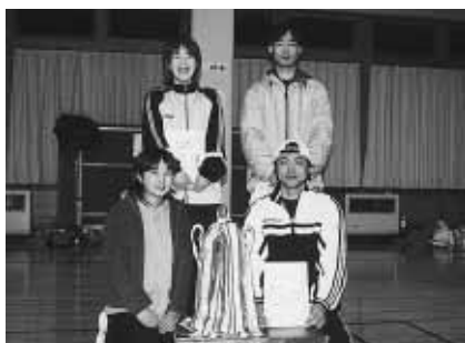
スーパリーグ優勝の ショーヨーBVC・Bの皆さん