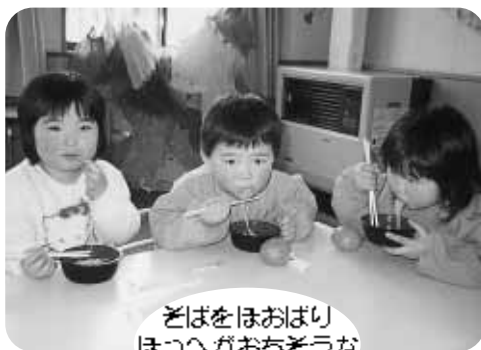
そばをほおばり ほっぺがおちそうな 子どもたち