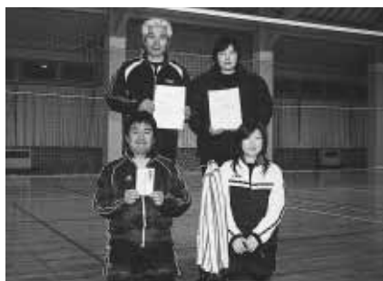
ほのぼのリーグ優勝の ショーヨーBVC・Aの皆さん