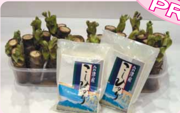
来場者にプレゼントされた村産のタラノメとコシヒカリ

杉並区役所で開催した物産展(4月7日・8日)の来場者に、村産のタラノメとコシヒカリをプレゼント。区民の皆さんに大好評でした。