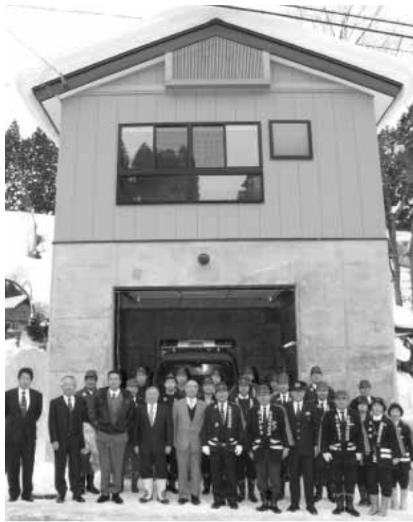
◀新しい屯所の前で、誓いを新たにした関係者の皆さん