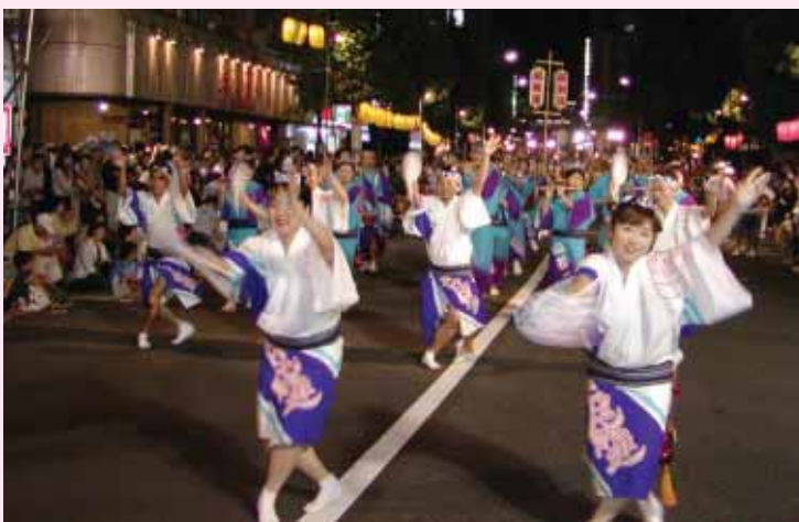
踊り手8,000人、観客120万人が訪れる杉並区の「高円寺阿波踊り」においても村PRイベントを開催する予定

今後、PRイベントは、約120万人もの観客が訪れるという「高円寺阿波踊り」など、杉並区で開催されるイベントなどにあわせて実施し、杉並区の皆さんをはじめ、首都圏の方々に当村を広く紹介していきます。