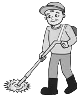
シルバー人材センターの会員になって