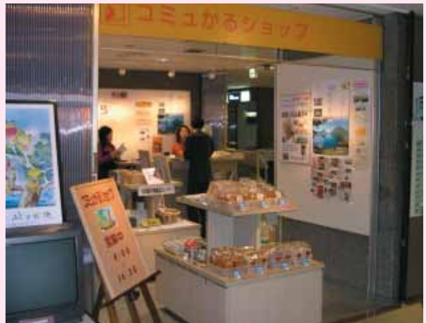
村の特産品が常設販売されるコミュかるショップ (杉並区役所内)

残雪が残る早春から、新緑がまぶしい初夏にかけての村内各地の風景を紹介する写真展のほか、既に観光客の皆さんに大好評となっている採れたて新鮮野菜や山菜、農産物加工品の展示販売、さらには、手打ちそばやお餅を振る舞うなどの物産展により、村ならではの魅力とおもてなしの心に触れていただこうと考えています。