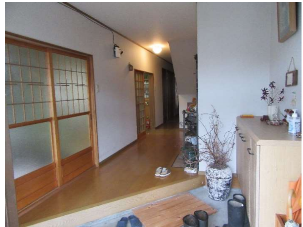
入り口玄関と廊下