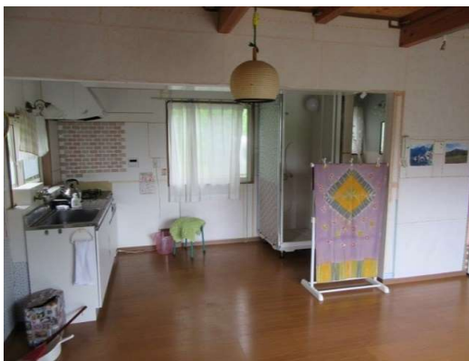
1階リビング③（キッチン・シャワー）