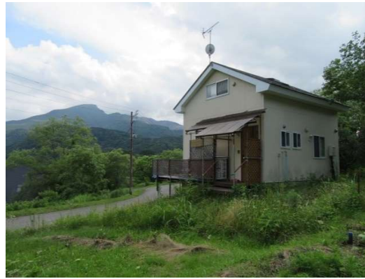
全景②（建物左側に見える山は磐梯山）