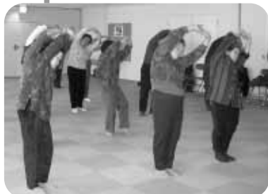
普段使わない筋肉を伸ばしました

11月30日（火）、ラピスパ裏磐梯において「せいじんセミナー」を開催しました。今回は、保健センター企画の「ながいきくらぶ」と共催で、25人が参加しました。