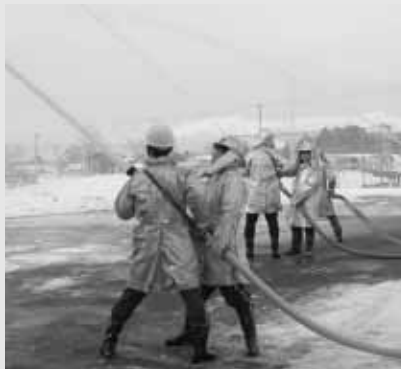
空に向かって一斉に水が放たれた放水訓練

北塩原村消防団出初め式が1月6日、村役場並びに村民体育館において、団員・婦人消防隊・来賓など約160人が参加し、実施されました。 団員らはきびきびとした動きで日頃の訓練の成果を十分に発揮し、今年一年間の無火災、無災害を願うとともに、住民の生命と暮らしを守る誓いを新たにしています。