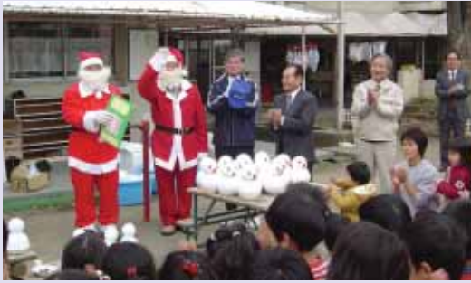
大歓迎を受ける商工会の皆さん（成田西幼稚園）

「まるごと保養地協定」による杉並区民の皆さんの受け入れがスタートした12月。7日には村広報12月号においてお知らせしたとおり同区教育委員会、そして15日には、同区議会議員の皆さん（区民生活委員会）が当村に訪れました。