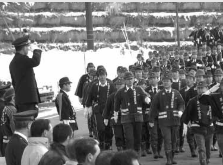
◀さっそうと行進する消防団員