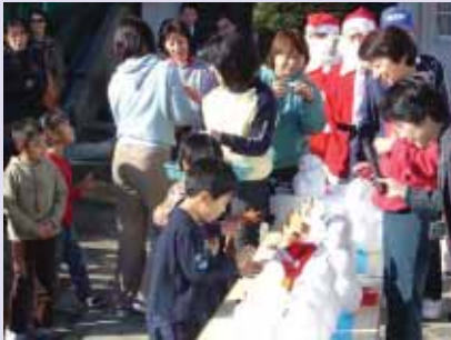
雪だるまに飾り付けを行う子どもたち（高円寺北幼稚園）

民の反響はかなりある。区民は環境問題に関心が高い。森のくまさん（松原湖周遊レトロパス）のように、環境に対する配慮を意識した取り組みを期待する。首都圏では「雪」は大きな魅力。などと、活発な情報交換がなされました。一行は翌16日にかけて、村内各地区、各観光・体験施設などを念入りに視察していかれました。