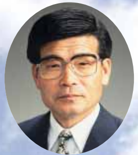
北塩原村長 高橋 伝