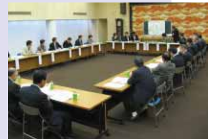
さまざまな情報が交換された懇談会

民の反響はかなりある。区民は環境問題に関心が高い。森のくまさん（松原湖周遊レトロパス）のように、環境に対する配慮を意識した取り組みを期待する。首都圏では「雪」は大きな魅力。などと、活発な情報交換がなされました。一行は翌16日にかけて、村内各地区、各観光・体験施設などを念入りに視察していかれました。