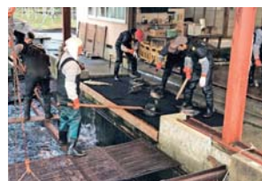
牛渡川を遡上する鮭の孵化場戻ってくるのは何年後？