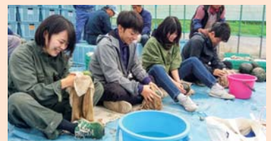
▲作業協力に来た農大生4名