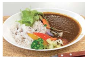
遊佐カレーは鳥海山・飛島ジオパーク認定商品の一つ。