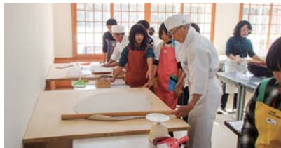
▲大塩のそば打ち体験