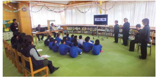
▲お話し「くまとやまねこ」

本に親しむ会は11月2日（金）講師に朗読サークル「アグリーダックス」の皆さんをお招きし、裏磐梯小学校で開催されました。場面に合わせた効果音や配役、スクリーンを使った読み聞かせに児童はもちろん、参加した保護者も絵本の世界を楽しんでいる様子でした。