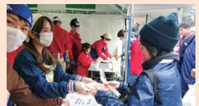
▲山塩ラーメンを販売している様子

11月11日(日)に川前地区の営農改善組合で行われた川前カボチャの磨き・選別作業に農大生4名が参加してくれました。今年は夏場の水不足の影響もあり、カボチャの収穫量は昨年の半分ほどで、型も小さめのものが多い状況でしたが、糖度(デンプン質量)は高くなっていました。組合の方からは「若い人たちが来てくれてとても助かった。また来て欲しい。」と声が聞こえ、農大生からは「大学では実習があまりないので、参加できてよかった。」などの声がありました。