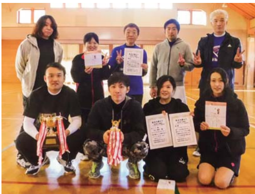
▲優勝、第3位に入ったショーヨーBVC

今年度、最後となるビーチボールバレー交流大会は11月25日（日）、活性化センターにて開催されました。今大会は村から5チーム、西会津町から3チームの合計8チーム（36名）が参加しました。予選リーグ～決勝トーナメントまで白熱した試合が行われ、ショーヨーBVCアイリスが優勝しました。大会後の懇親会では親睦を深め、来年の大会まで更に練習に励むことを誓い合いました。