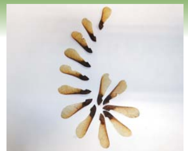
▲実がクルクルと回転する様子(イメージです)

普段何気なく見ていた「カエデの仲間の実」のクルクルと回って落ちてゆく光景の中に、このようなメカニズムが隠されていたことに驚きですね。皆さんも是非観察してください。