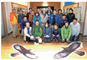
鳥海イヌワシみらい館にて手前にあるイヌワシの絵は実物大！