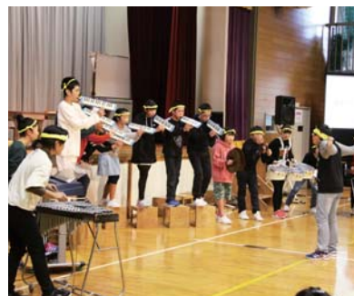
▲最高の思い出を！ (6年生による演劇)