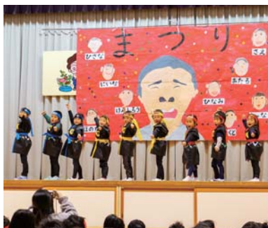
▲楽しく元気いっぱい！ (園児等による遊戯)

午後になると保護者らによる楽しい歌や踊りのほか、地域の方々の日頃から取り組んでいる芸能がそれぞれ発表されるなど、会場は終始、笑顔に包まれました。