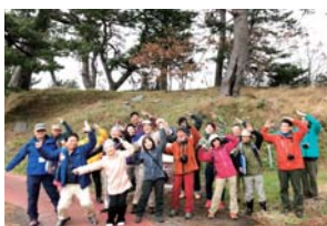
鳥海山の麓にある流れ山の前で磐梯山の「流れ山ポーズ」

今回は磐梯山ジオパーク協議会運営委員、ジオパークガイド、磐梯山ジオパークカレー提供店、宿泊施設や飲食店などのメンバーが参加し、交流を通して今後の活動につながる良い刺激を互いに受けることができました。