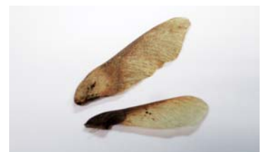
▲実の付け根部分に種子が入っています。