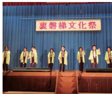
▲「花笠音頭」(松原長寿会)