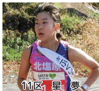
11区 星 夢