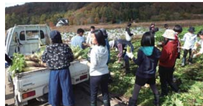
▲早稲沢の大根畑で収穫体験