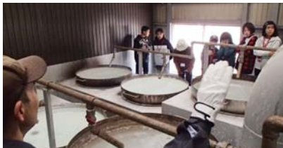
▲会津山塩の製塩所を見学

10月24日から27日までの4日間、沖縄県東村の中学生15名が「交流の翼」訪問団として北塩原村を訪れました。訪問中は、そば打ち体験、会津山塩工場の見学、農業体験や民泊体験等を通して村の方々と交流を深め、秋晴れの中、沖縄では見ることのできない紅葉や会津の歴史・文化に触れて充実した時間を過ごしました。ご協力いただきました皆様、ありがとうございました。