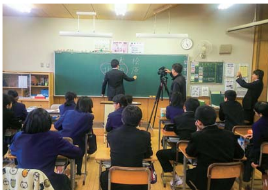
▲撮影風景(裏磐梯中学校)