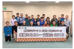
「華麗なるカレー交流会」次回は磐梯山でお待ちしています！