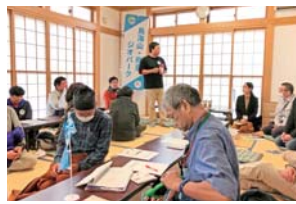
互いの「カレー」について紹介今後の展開に刺激を受けました！