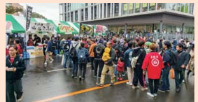
▲北塩原村のブースに並ぶ行列