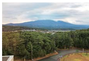
あいにくな天候の2日間でしたが鳥海山が顔を見せてくれました！