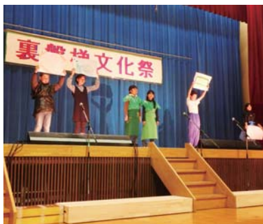
▲「山塩クエスト～裏磐梯の冒険～」