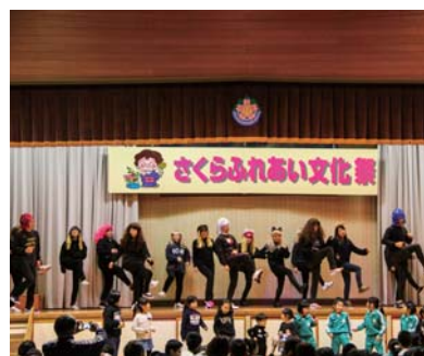
▲会場を盛り上げた PTAによるダンス発表