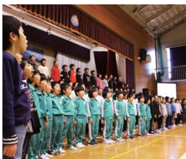
▲来場者全員による合唱