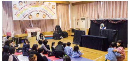
▲人形劇「三枚のお札」の様子

迫力ある人形に驚いて逃げる子どももいましたが、参加した子ども達は人形劇のお話の世界に夢中になり、楽しんでいました♪