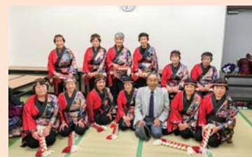
▲会場大ホール控室にて