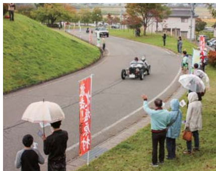
▲観客が待ちわびた先頭ドライバーが到着

今回8年ぶりに裏磐梯ルートが復活した「ラフェスタ ミッレ ミリア」。チェックポイントの村役場には、村民や県内外のファンが多数駆けつけ、ドライバーに声援を送りました。