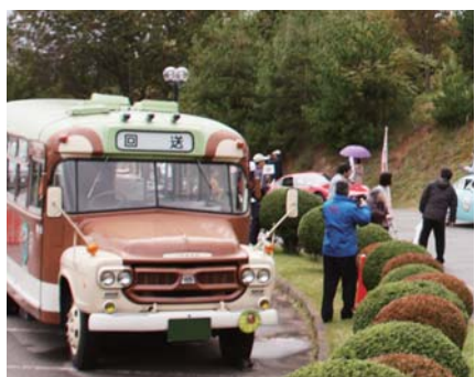
▲イベントに合わせて特別に展示されたレトロバス「森のくまさん」。来場者の注目を集めました