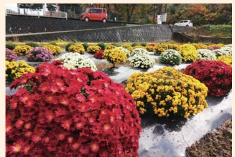
▲11月1日ザル菊開花状況

また、川前のザル菊圃場を過ぎて、上川前に向かうと「エミュー試験飼育場」があります。柵の中に入れてませんが、エミューも順調に成長していますのでぜひ見に来てください。