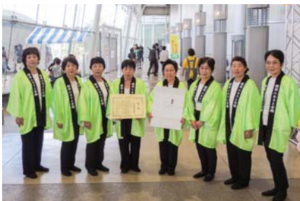
▲ビッグパレットふくしまにて受賞された芸能部の皆さん