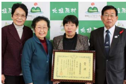
▲村長へ受賞を報告