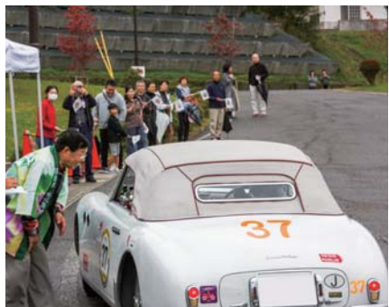
▲旗を振ってドライバーを歓迎