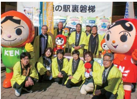
▲活動に参加された皆さん

人権啓発活動は、10月28日、道の駅裏磐梯で北塩原村・喜多方市・西会津町の人権擁護委員12名が参加し実施されました。