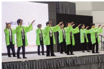
▲実践報告「松原ふるさと音頭」の披露