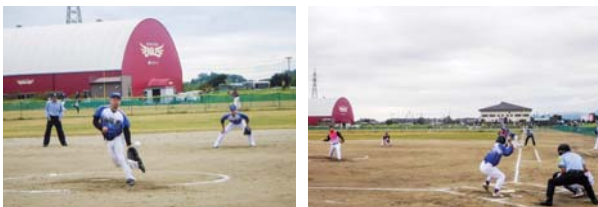
▲最後まであきらめず健闘しました。

第5回市町村対抗福島県ソフトボール大会は10月13日（土）から相馬光陽ソフトボール場で開催されました。村代表チームは翌14日（日）に伊達市と対戦し、満塁で先制点のチャンスを作る場面などもあり健闘しましたが、0対7で敗れました。