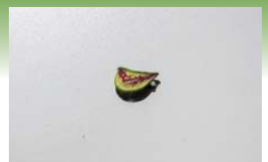
▲又スビトハギの実