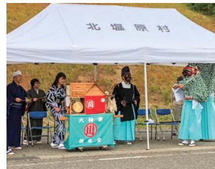
▲大塩川前神楽による安全祈願の舞