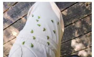
▲ズボンについた実