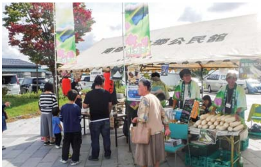
▲イベントにおけるブース出店の様子

当日は村から北塩原若者交流の場、和DO改珍、じゅんさい寿限無の3つの青年団体が合同でブースを出店し、山塩やきとりや高原だいこんなどを販売しました。また、イベント終了後には栃木県日光市、山形県南陽市と川西町の各青年団体と今後の地域活性化に向けた意見交換などを通して交流を深めました。