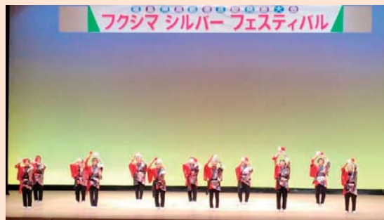
▲会場大ホールにて演目披露

私も毎回練習に参加させてもらい、気持ち良く練習いただけるように会場や音源の準備、踊りの写真や動画を撮り参考にしてもらおう、踊りの道具の繕いなども皆さんと楽しみながら取り組ませていただき、ありがとうございました。