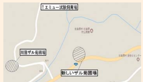
▲ザル菊圃場へのアクセス