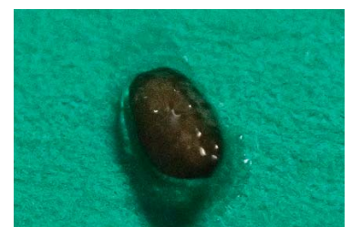
▲ゼリー質の膜に包まれた種子