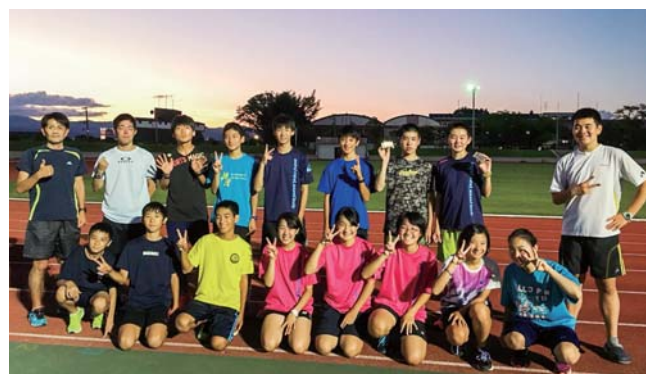
▲昨年よりも上位を目指します!

今後も、駅伝チームの成長記録を紹介してまいりますので、村民のみなさんの応援をよろしくお願いいたします!