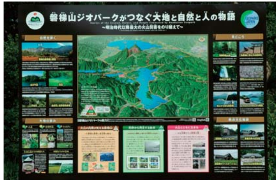
①五色沼入口観光プラザ駐車場(裏磐梯観光協会)

磐梯山ジオパークの案内解説看板をご存知ですか? 「いまさら」とおっしゃって頂けると嬉しいのですが、なかなかお気づきいただけないかもしれません。それは看板を景観に配慮した茶色ベースにして、いる事や設置場所を控えめにしているからでしょうか。