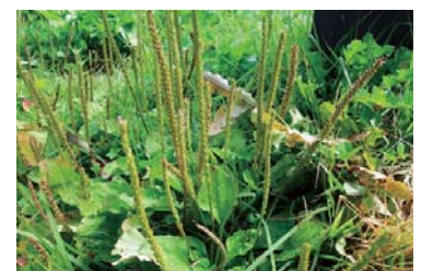
▲道端に生えるオオバコ

ところで、オオバコの学名Plantagoには、「足の裏で運ぶ」という意味が含まれており、中国名の「車前草」は、牛車や馬車の通る道端に多いことに由来するとされています。オオバコの実は、長さ5mmほどのカプセル状をしており、熟すと外からの刺激で、上半分が外れるつくりになっています。実の中には、4～8個ほどの小さな種子が入っていて、おもしろいことに、濡れるとゼリー質の膜に包まれるようになっていきます。種子の表面が水を吸うと膨らんでゼリー質になる食物繊維の被膜に覆われているのです。雨や露で濡れた種子は、このゼリー質の膜でぺたぺたと粘り、人の靴や車のタイヤにくっついて運ばれていくという仕組みです。オオバコが私たちの身近に多い理由は、種子の運ばれ方と関係があったのです。