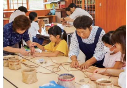
▲編細工(協力:てわっさの会)

運営スタッフとして、大塩長寿会・てわっさの会・発掘作業員の皆様にご協力をお願いしました。