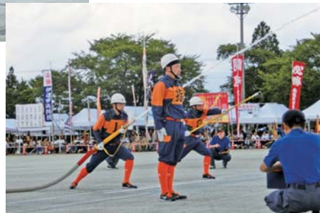
▼小型ポンプ操法の部