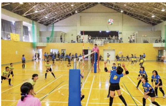
▲熱戦を繰り広げるさくらスポ少

第26回火の山杯バレーボール大会が8月18日(土)に村民体育館を会場に開催され、バレーボール8チームが参加し、熱戦を繰り広げました。