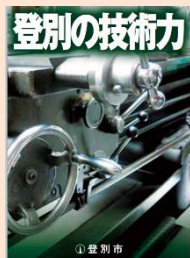
登別市企業力調査