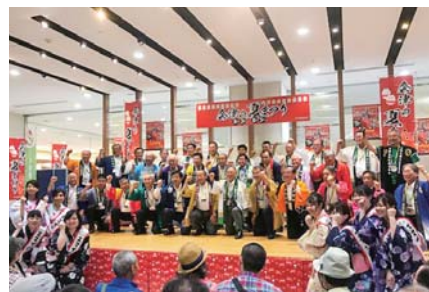
▲会津17市町村長が一丸となってPR(イトーヨーカドー西新井店)