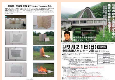
登別アーティストインレジデンス各種プログラム