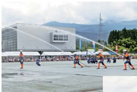
▲ポンプ車操法の部