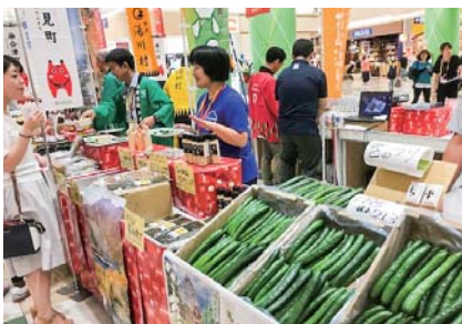
▲会津の農産物を首都圏消費者へお届け

東京都足立区イトーヨーカドー西新井店内では「会津の夏祭り」を開催し、首都圏消費者に対して農作物と特産品の販売を行い、多くのお客様が訪れました。