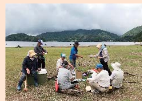
金山浜にてグラウンドゴルフ