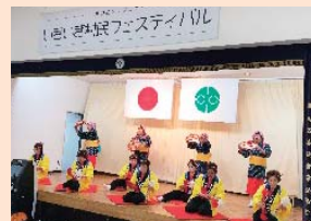
村民フェスティバル左「ドンパン節」右「花笠音頭」