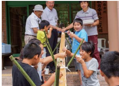
▲科学工作教室and流しそうめん (協力:大塩長寿会)

手作りの暖かさを感じたり、科学に触れたり、歴史に触れたりして、体験を通して夏の思い出作りの場となったとともに、年齢や地域を越えた交流の場ともなりました。