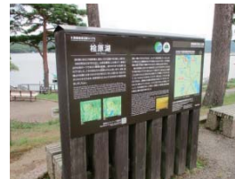
④ 桧原湖第一駐車場(遊覧船乗り場)