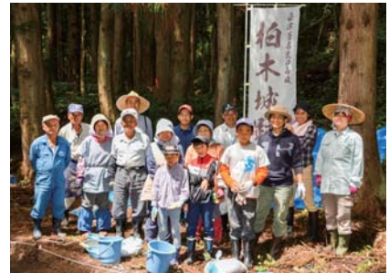
▲柏木城発掘体験 (協力:発掘作業員)