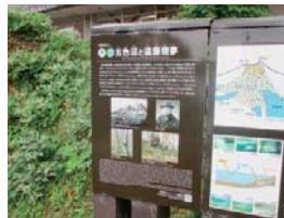
③ 裏磐梯物産館前(柳沼)