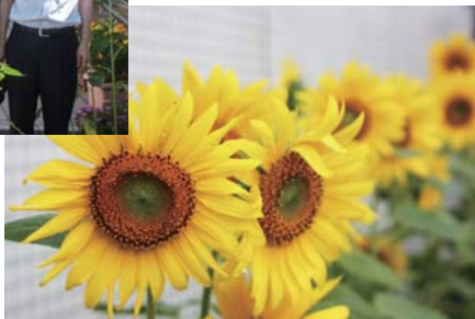
元気に咲いたひまわり▶

8月22日(水)に喜多方ロータリークラブより、ひまわりのプランター15鉢が寄贈されました。