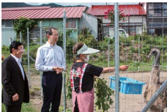
▲真剣にエミューの話聞く内堀知事