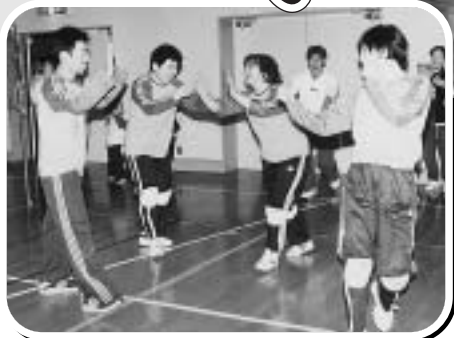
写真 右 ほのぼのリーグ優勝の「ラガーチーム」 写真 左 スーパーリーグ優勝の「リップスティックブラックチーム」