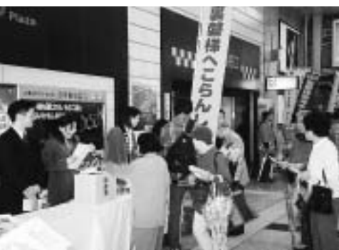
東京の人達の反応は上々!!