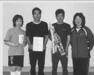
ほのぼのリーグ優勝の ドリームA