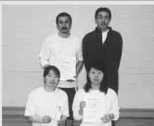
スーパーリーグ優勝の リップスティックレッド