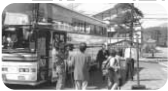
◀記念すべき第1号が到着（4月29日）

東都観光ツリスト（株）が主催する東京／池袋と裏磐梯を結ぶ、高速・直行バス「五色沼号」が運行を開始しました。