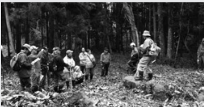
▶ 説明に聞き入る参加者の皆さん

柏木城には、石積や土塁、馬出などの史跡が400年以上の時を越えて残っており、参加者は各史跡での説明に耳を傾けたり、質問したりして北塩原村の歴史を体感していました。