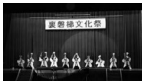
▲長寿会の踊りと中学生の合唱