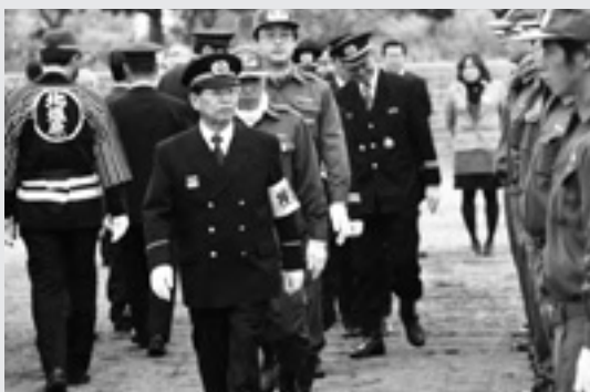
▶各分団員の通常点検を行う様子