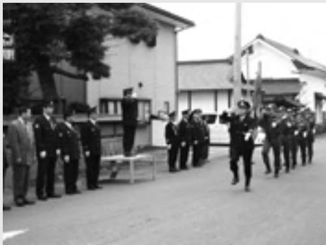
▶行進する村消防団