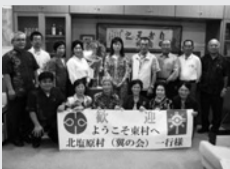
▶ 東村にてハイチース！

東村からの参加者からは、来年はこちらから何うというお話があり、今後の相互交流への発展が期待されることとなりました。