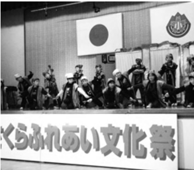
▲小学生から元気もらいました！

今年度は、午後になっても多くの小学生が会場に残り、ジオパークの説明を聞いたリ、保護者と一緒に歌い、踊ったり、最後まで文化祭を盛り上げてくれました。 フィナーレに全員で歌った「もみじ」の大合唱が地域の絆をより一層深めたように感じられました。