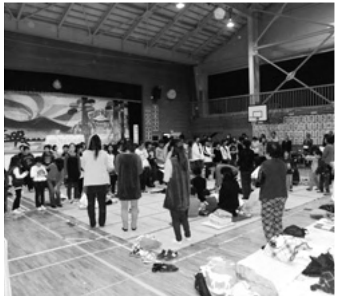
▲フィナーレを飾った「もみじ」の大合唱