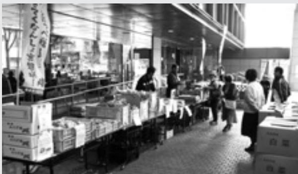
▶杉並区で開催した産直市の様子