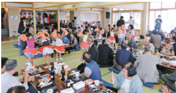
令和元年度敬老会の様子

そうした考えもありますが、このコロナ禍での結論として出されたものだと思っています。次年度、皆さま方とともに喜びあえる機会があることを切に願っております。