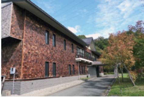
裏磐梯浄化センター