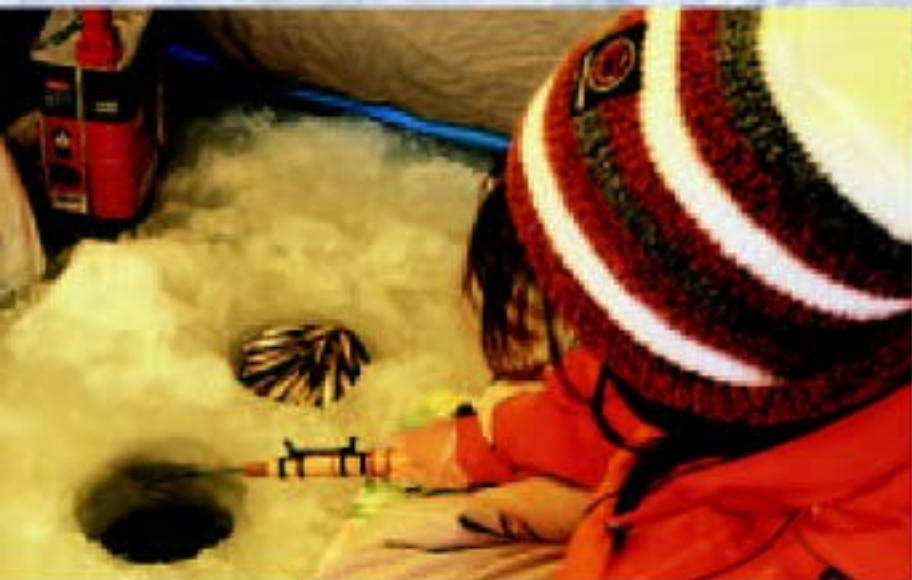
初開きのわかさぎ釣り