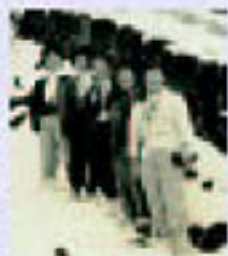
▲友達と初詣に行った時の1コマ

たっても忘れられないもので、笑を覚るたび一瞬に思いの思い出が蘇ってきます。今はお美師様に初詣に行っても人がいなくて寂しいですね。今の子ども達も心のゆとりを持って、仲間作りをして欲しいです。村の同級生との関係は、普通の友達とは違った感じですからね。