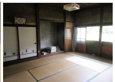
和室 10 畳