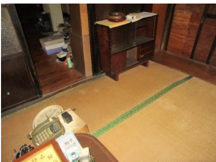
和室 6 畳