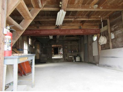
入り口蔵から奥が玄関