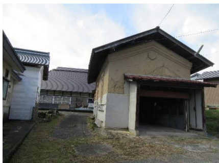
蔵2／正面入り口付近