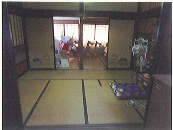
仏間から奥左居間6畳と右居間8畳