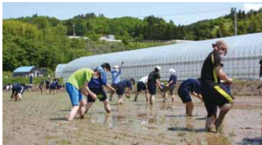
稲作体験/第一中学校