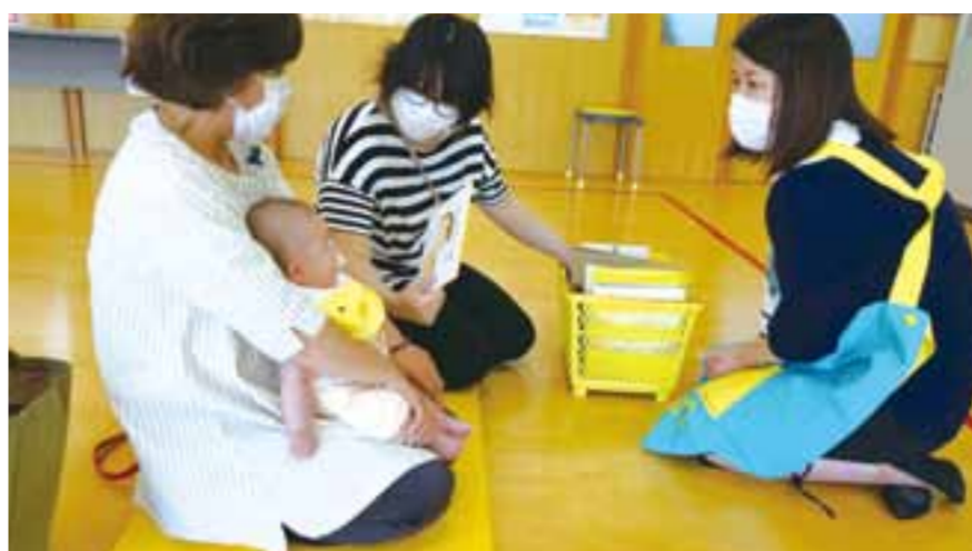
ブックスタート事業