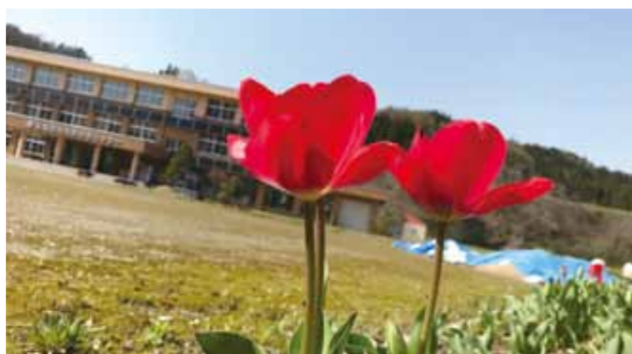
生涯学習センターのチューリップ