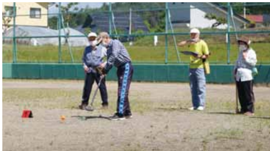
グラウンドゴルフ/北山長寿会