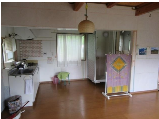
1階リビング③（キッチン・シャワー）