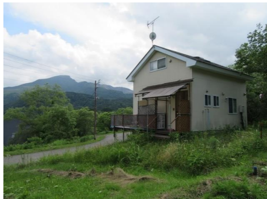
全景②（建物左側に見える山は磐梯山）