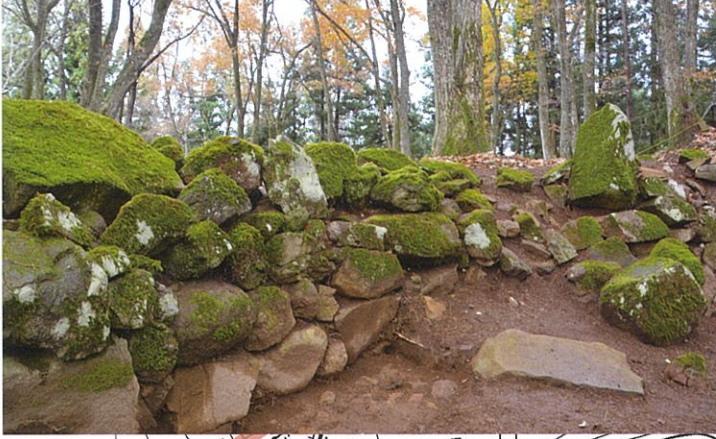
《武威を示す⑤》主郭への玄関口となる虎口2付近に石を積み、階段状に積み、高さを出している。