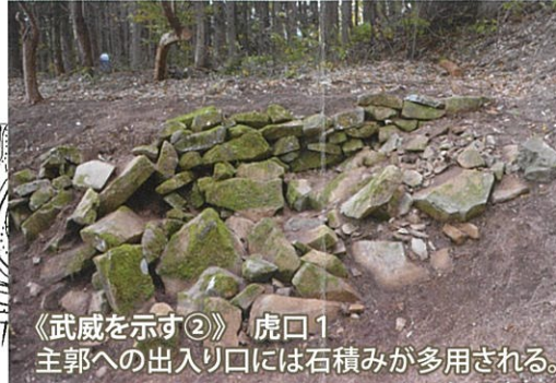
《武威を示す②》 虎口1 主郭への出入口には石積みが多量に用いられる。