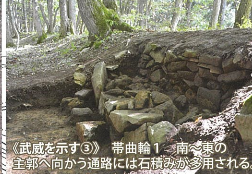
《武威を示す③》 帯曲輪1 南〜東の 主郭へ向かう通路には石積みが多量に用いられる。