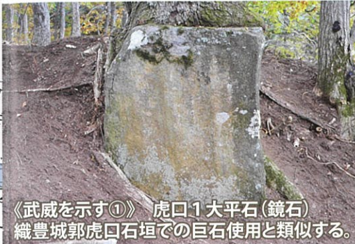
《武威を示す①》 虎口1 大平石(鏡石) 織豊城郭虎口石垣での巨石使用と類似する。