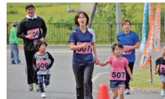
村民ふれあい健康マラソン大会