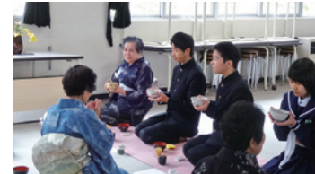
異世代交流・茶道体験