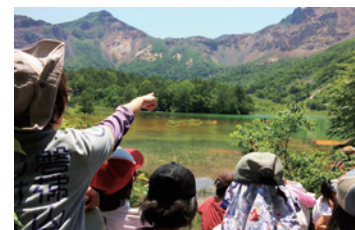
ジオパーク出前授業