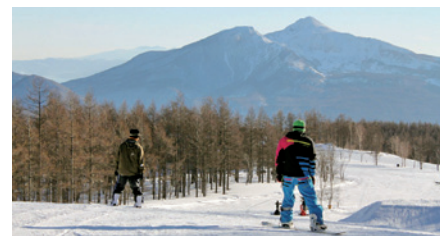
豊富なアクティビティ（村内に3つあるスキー場）