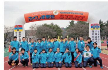
ふくしま駅伝大会