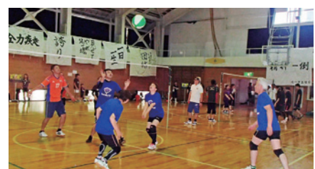
村民への学校体育館の開放