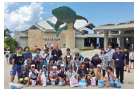
ちびっこ探検学校（沖縄）