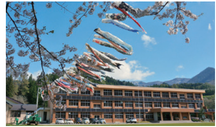
生涯学習センター