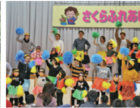
学校・幼稚園・地域合同の運動会と文化祭