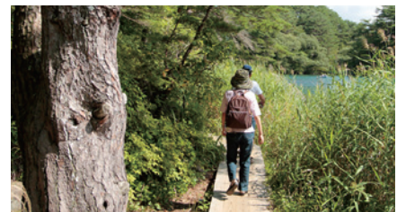
自然に囲まれたトレッキングコース