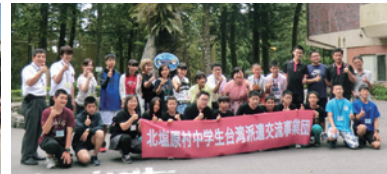
台湾派遣交流事業