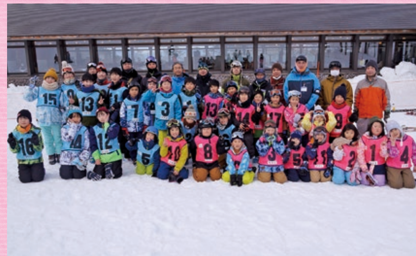
少年少女スキー教室