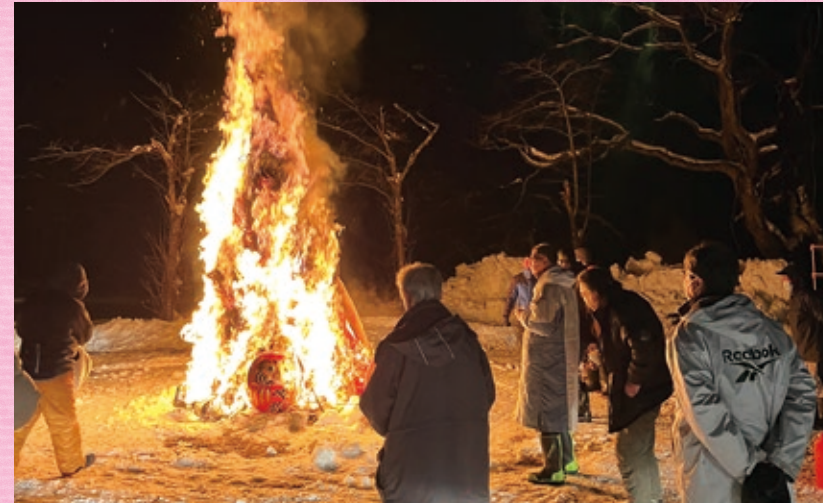
歳の神・蛇平地区