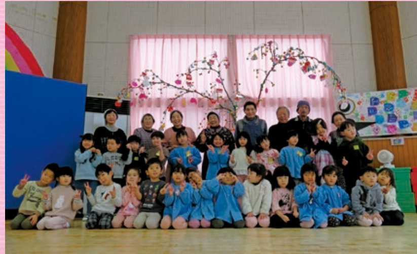
だんごさし・さくら幼稚園